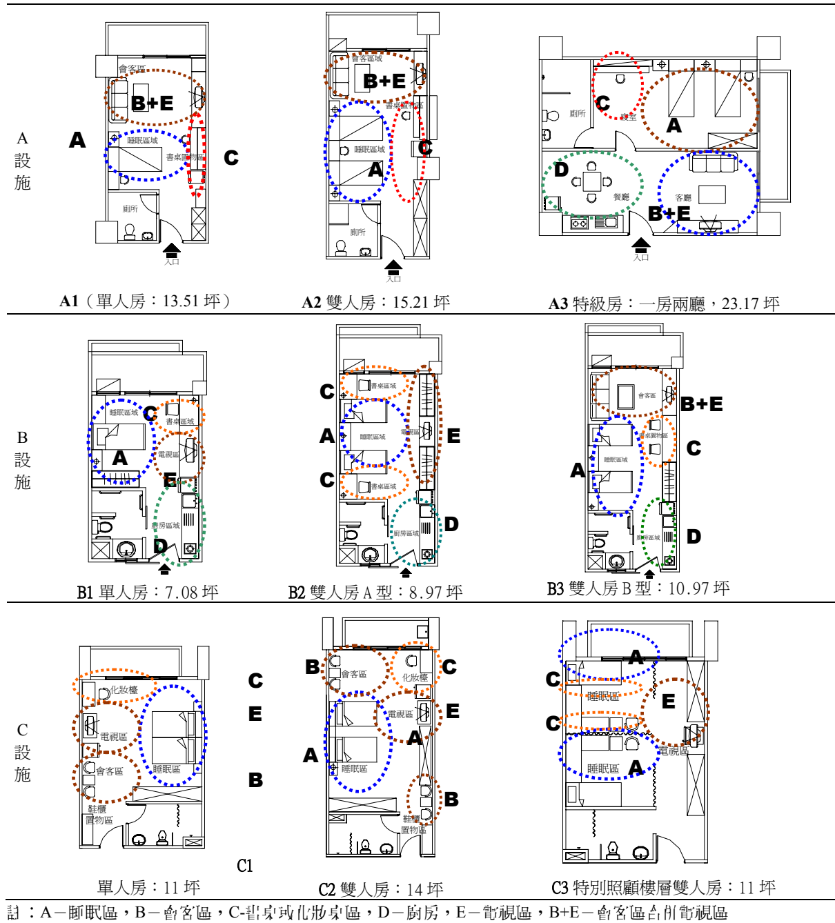
表 3 居家設施居住單元配置型態比較表